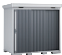
CG チャコールグレー