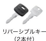
リバーシブルキー (2本付)