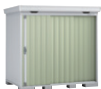
JG ジェードグリーン