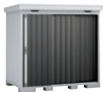
EB エボニーブラウン