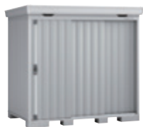
PS プラチナシルバー