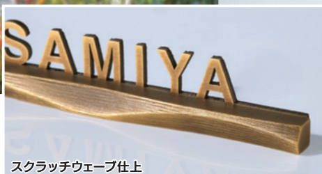
スクラッチウェーブ仕上