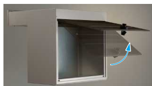
取出口ぶた保持機能