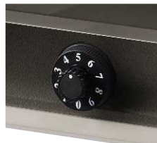
簡易ダイヤル錠(注2) (1桁合せタイプ)

防犯性に配慮しつつ、簡単な操作で施解錠できる簡易ダイヤル錠(1桁合せタイプ)を標準装備。※オプションでダイヤル錠(2桁合せタイプ)に変更が可能です。