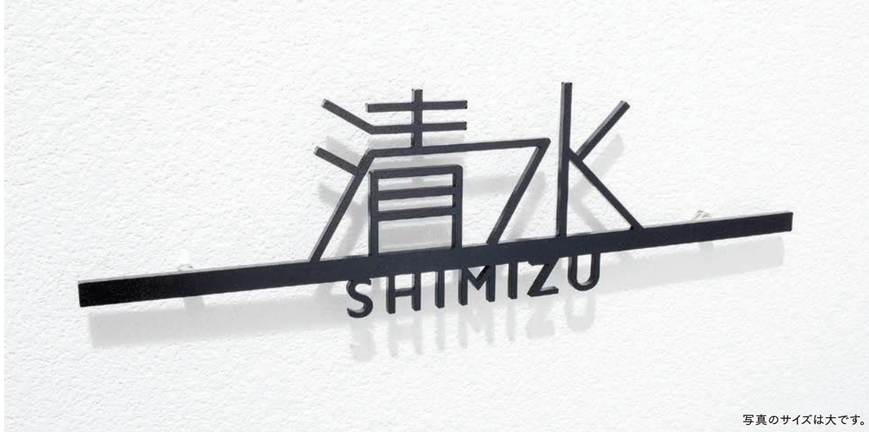
写真のサイズは大きです。