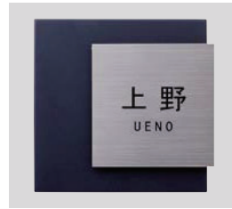
デザインB チタンヘアライン 文字:黒 和文:角ゴシック 欧文:ゴシック ボールド