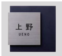
デザインC チタンヘアライン 文字:黒 和文:角ゴシック 欧文:ゴシック ボールド