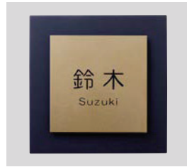
デザインA ゴールド 文字:黒 和文:丸ゴシック 欧文:丸ゴシック