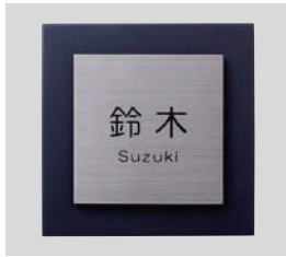
デザインA チタンヘアライン 文字:黒 和文:丸ゴシック 欧文:丸ゴシック

※時を超える素材、日本製鉄のデザインチタン「トランティクシー」を使用しています。