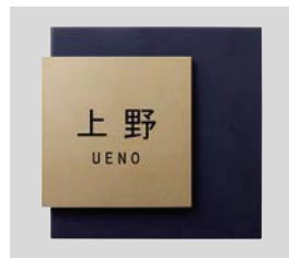
デザインC ゴールド 文字:黒 和文:角ゴシック 欧文:ゴシック ボールド

商品の色は印刷の性質上、実物と多少違うことがあります。表示価格には消費税・工事費・配送費は含まれていません。