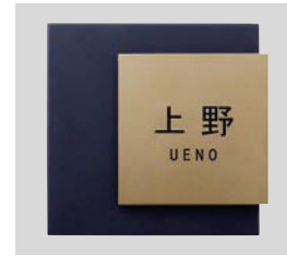
デザインB ゴールド 文字:黒 和文:角ゴシック 欧文:ゴシック ボールド