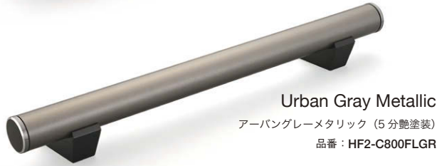
Urban Gray Metallic アーバングレーメタリック (5分艶塗装) 品番: HF2-C800FLGR