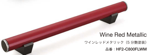
Wine Red Metallic ワインレッドメタリック (5分艶塗装) 品番: HF2-C800FLWM

※ 両側面部・脚部はカーボンブラックメタリック (5分艶塗装) のツートンカラー仕様です。