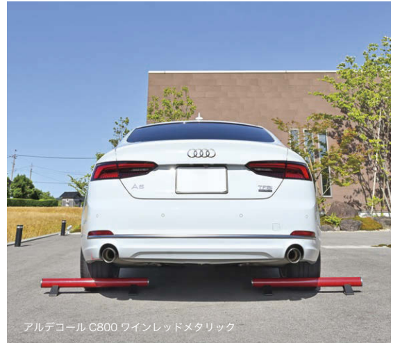
アルデコール C800 ワインレッドメタリック

※ 両側面部・脚部はカーボンブラックメタリック (5分艶塗装) のツートンカラー仕様です。