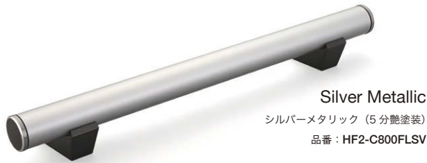
Silver Metallic シルバーメタリック (5分艶塗装) 品番: HF2-C800FLSV

日本 10日 在庫切れの場合は2~4週間程度かかります。 送料別途 商品検査オンサーチ参照 RIKCAD 登録商品