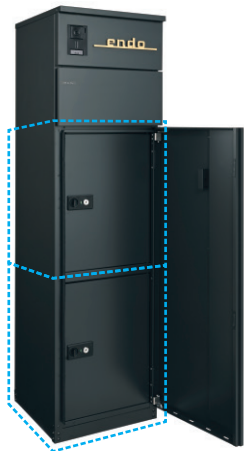
1ボックス当たりの投函可能サイズ(100サイズ)※1