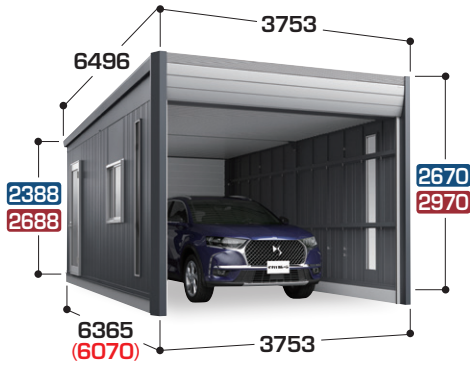
ガラス窓(GDR-2J)、FIX 窓×2 はオプション

高さ寸法は ハイルーフ ジャンボ です。 ( )は本体内部奥行寸法 写真は一般型TypeB ジャンボ 床面積：23.10㎡ (7.00 坪)