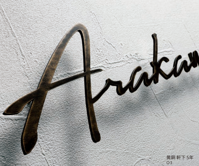
黄銅 軒下5年 O3