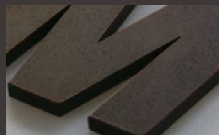
黒皮鉄 赤錆A K1