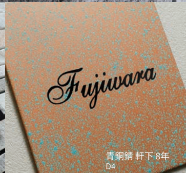
青銅錆 軒下8年 D4