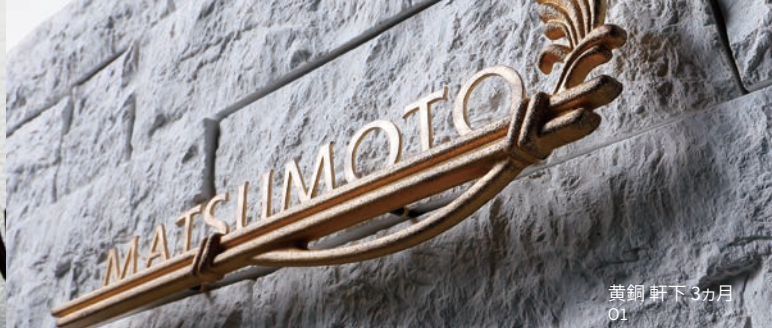
黄銅 軒下3ヵ月 O1