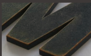
黒皮鉄 茶錆A K6