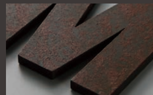
黒皮鉄 赤錆C K3