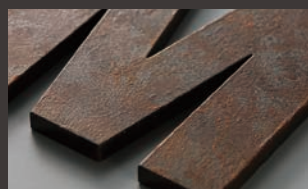
黒皮鉄 茶錆B K7