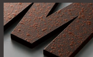
黒皮鉄 赤錆E K5