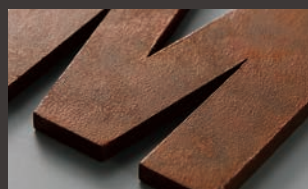
黒皮鉄 赤錆D K4