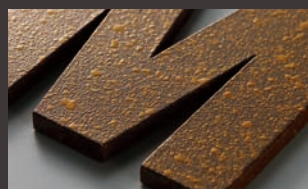
黒皮鉄 茶錆C K8