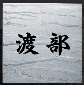
TI-207 チタン運龍(うんりゅう)