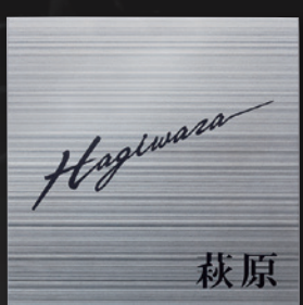
TI-219 チタンストリングス

※アイコンの付いた商品は「案ロック(別売)」に対応しています。(P205) ・文字色の変更、追加についてはP201をご参照ください。