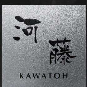
TI-208 チタン銀河(ぎんが)