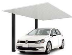
27-50型 柱・梁:ブラック 屋根材:ナチュラルシルバーF