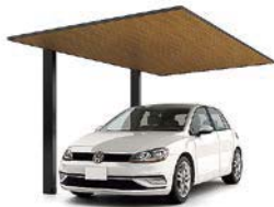
27-50型 柱・梁:ブラック 屋根材:ブラック+チェリーウッド