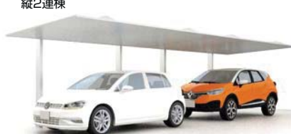
縦2連棟 27-50型 柱・梁:ナチュラルシルバーF 屋根材:ナチュラルシルバーF