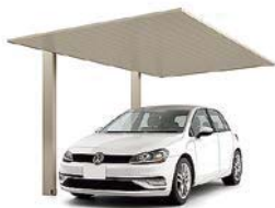
27-50型 柱・梁:シャイングレーフ 屋根材:シャイングレーフ