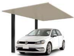
27-50型 柱・梁:ブラック 屋根材:シャイングレーフ