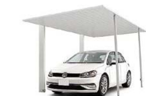
耐積雪・耐風圧パッケージ ナチュラルシルバーF

※サポート数は、オプションのサポートを取り付ける際の必要数です。セット価格には含まれていません。