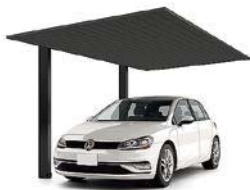
27-50型 柱・梁:ブラック 屋根材:ブラック