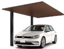
27-50型 柱・梁:ブラック 屋根材:ブラック+クリエモカ