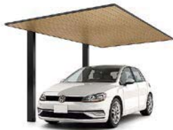
27-50型 柱・梁:ブラック 屋根材:ブラック+オーク