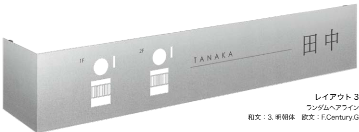
レイアウト 3 ランダムヘアライン 和文：3. 明朝体 欧文：F.Century.G