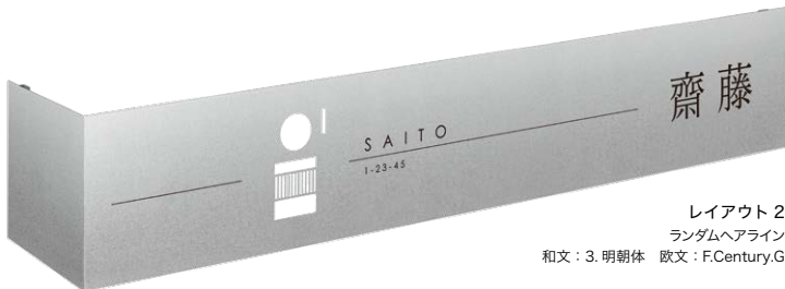
レイアウト 2 ランダムヘアライン 和文：3. 明朝体 欧文：F.Century.G