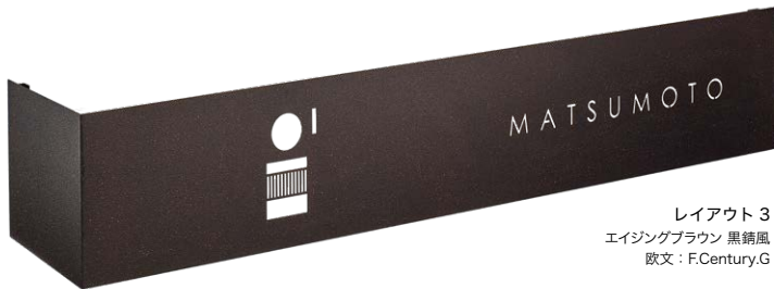
レイアウト 3 エイジングブラウン 黒錆風 欧文：F.Century.G