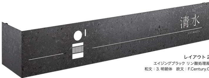
レイアウト 2 エイジングブラック リン酸処理風 和文：3. 明朝体 欧文：F.Century.G