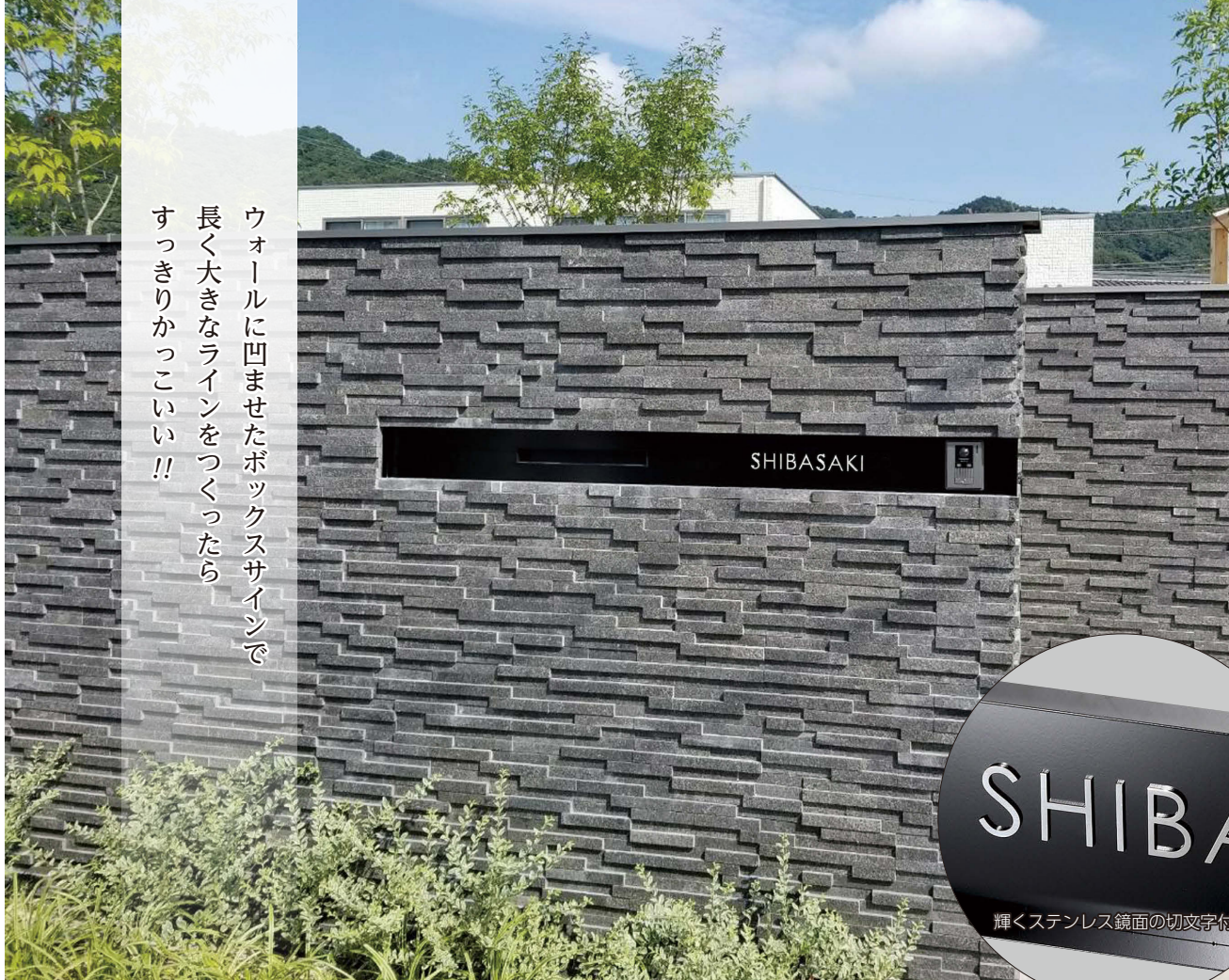
■ 使用貼り材：東洋工業株式会社 オークルストーンスティック 色：バーナーブラック

ウォールに凹ませたボックスサインで 長く大きなラインをつくったら すっきりかっこいい!!