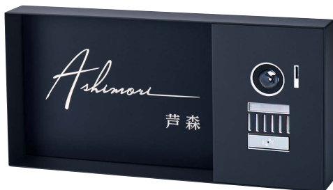
写真は右向き (R) です