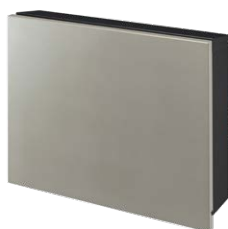
フロストグレージュ NA1-PTP01FJC