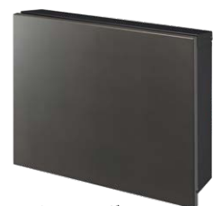
フロストチャコールグレー NA1-PTP01FCC