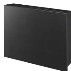
フロストブラック NA1-PTP01FKC