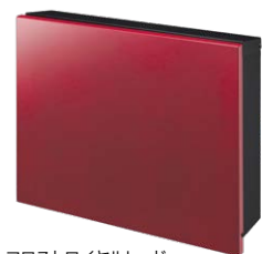
フロストロイヤルレッド NA1-PTP01FRRC NEW