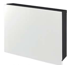
フロストホワイト NA1-PTP01FWC

ダイヤル錠 3日 大型配達物対応 RIKCAD 登録商品 ネームシート対応 下記参照 ポストスタンド対応 P.342 ~ 343 参照