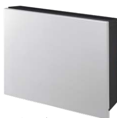
フロストシルバー NA1-PTP01FSC