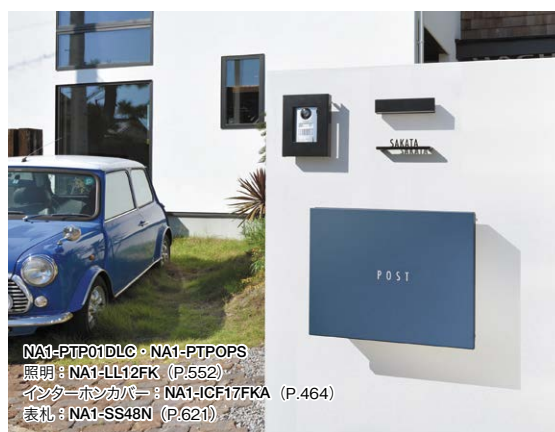
NA1-PTP01DLC・NA1-PTPOPS 照明: NA1-LL12FK (P.552) インターホンカバー: NA1-ICF17FKA (P.464) 表札: NA1-SS48N (P.621)