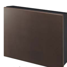
フロストブラウン NA1-PTP01FRC