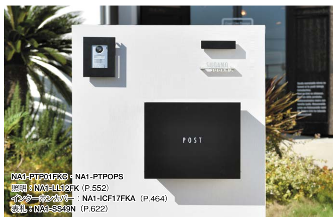
NA1-PTP01FKC・NA1-PTPOPS 照明: NA1-LL12FK (P.552) インターホンカバー: NA1-ICF17FKA (P.464) 表札: NA1-SS49N (P.622)