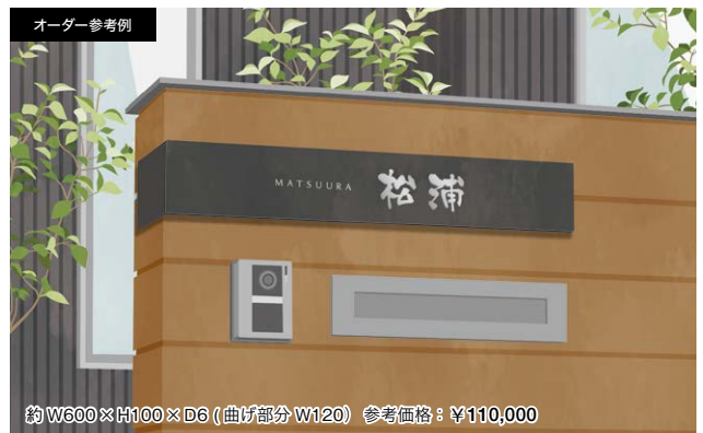
約 W600 × H100 × D6 (曲げ部分 W120) 参考価格：¥110,000