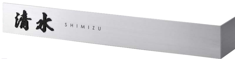
片曲げベース (右) + キリモジ (漢字バラ) + ガビオン取付プレート (別途)