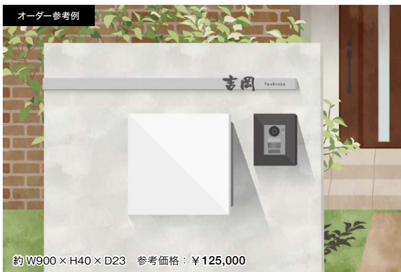
約 W900 × H40 × D23 参考価格：¥125,000