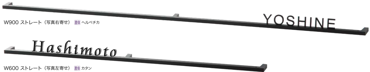
W900 ストレート (写真右寄せ) ■ヘルベチカ

※ 文字位置はご指定がない場合は右寄せレイアウトになります。 i 文字位置のご指定や二世帯仕様も対応可能です。お問い合わせください。 (右寄せ / 中央 / 左寄せからご指定ください。)