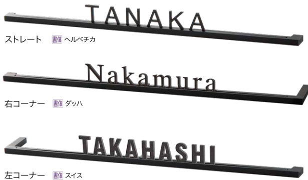
ストレート ■ヘルベチカ

※ 文字位置はご指定がない場合は中央レイアウトになります。 (右寄せ / 中央 / 左寄せからご指定ください。)