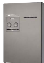
コンボメゾン ハーフタイプ