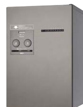
コンボメゾン ミドルタイプ