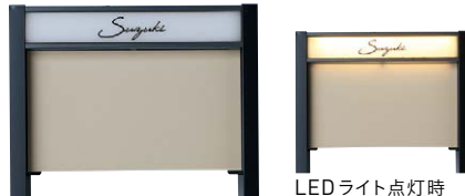
[レイアウト]レイアウトA