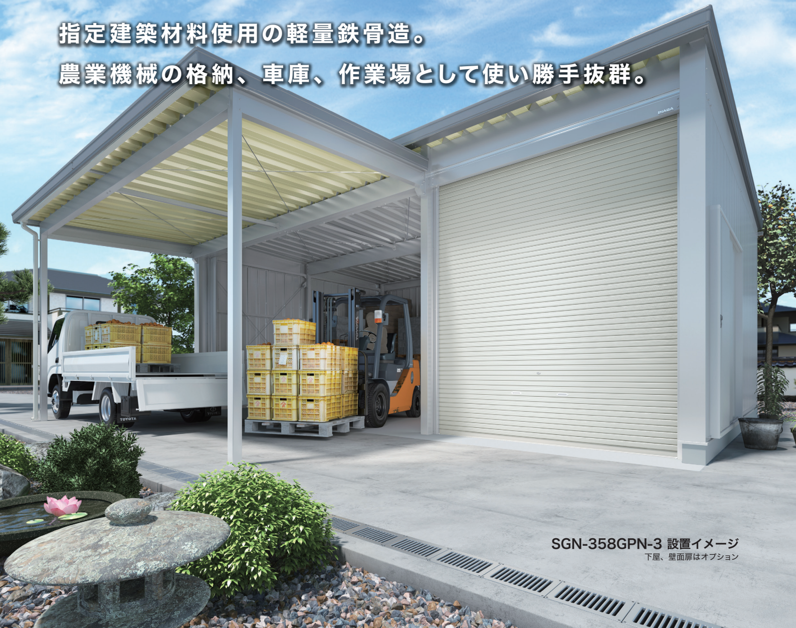
SGN-358GPN-3 設置イメージ 下屋、壁面扉はオプション