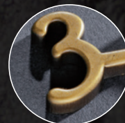
パイプレーション仕上げ