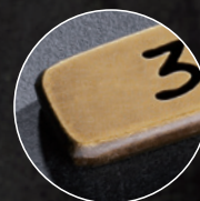
パイプレーション仕上げ