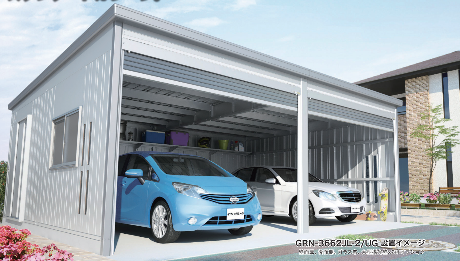
GRN-3662JL-2/UG 設置イメージ 壁面扉、後面棚、ガラス窓、大型採光壁×2はオプション