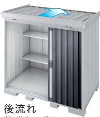
後流れ (標準タイプ)