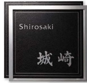
KT-113 ステンレス板エッチング