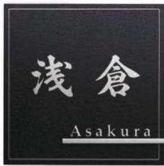
KT-115 ステンレス板エッチング

※ アイコンの付いた商品は「楽ロック(別売)」に対応しています。(201頁参照) ● 切文字は書体や文字の大きさ、形によっては製作できない場合がございます。