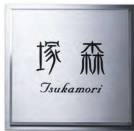
KT-112 ステンレス板エッチング(2層)