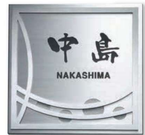
KT-31 ステンレスエッチング&デザインアート切抜き