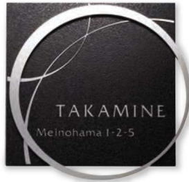
KT-110 ステンレス板エッチング