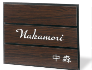
AB-26 アルブル（ダークチェリー） 製作日数 実働5日 49,000円（税込53,900円）