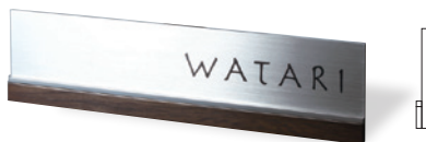
AB-1P アルブル（ダークチェリー） 製作日数 実働5日 36,000円（税込39,600円）

車やビルの内外装で実績のある木目転写を 屋外用アクリルに施し、さらにトップコートで保護した新素材。 天然木の趣きはそのままに耐候性に優れています。