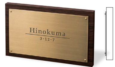
AB-27K アルブル（ダークチェリー） 製作日数 実働10日 54,000円（税込59,400円）