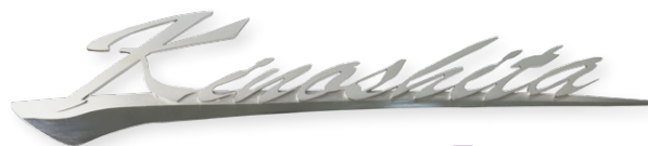
書体 AKI スクリプト