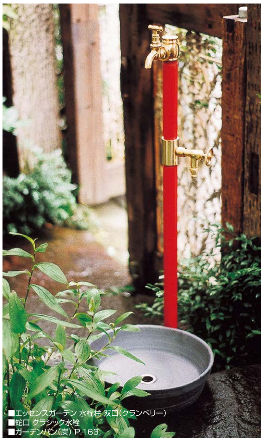
■エッセンスガーデン 水栓柱 双口(クランベリー) ■蛇口 クラシック水栓 ■ガーデンズ(股) P.163