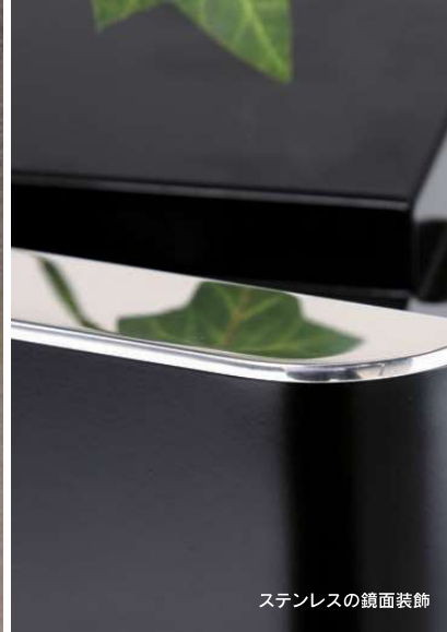
ステンレスの鏡面装飾