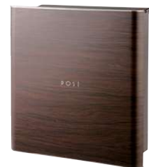
PGR-D(木目調・ダークチェリー)