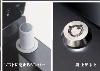
ソフトに閉まるダンパー