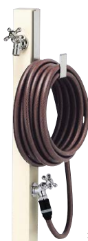
※ホースは付属しておりません。