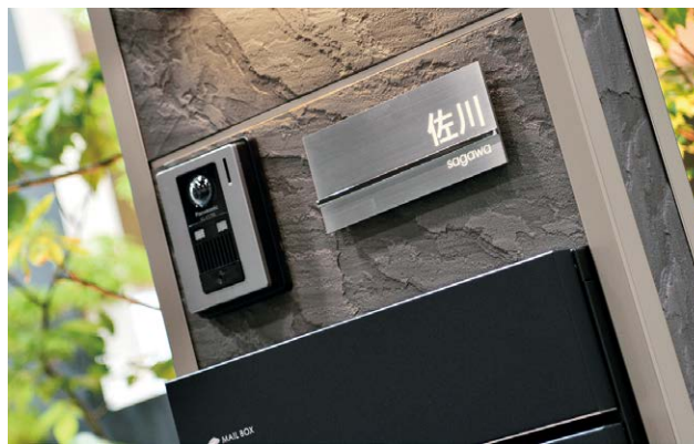
180×80 レイアウトJ2 [文字色]ベージュ [漢字書体]UN角ゴシック、[英数字書体]UNアバンギャルドゴシック(門柱ユニット)カーサDR(宅配ボックス)ヴォコ DB

ヘアライン仕上げのマットなベースに、つやのある鏡面仕上げのアクセントバーを組み合わせたスタイリッシュなサイン。