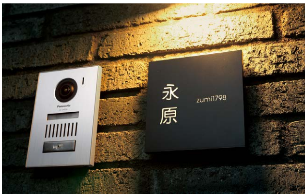
150×150 レイアウトQ:ブラック [文字色]ホワイト [漢字書体]UN丸ゴシック、[英数字書体]UNアバンギャルドゴシック