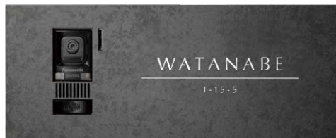
レイアウト 3 品番 : IP1-30-AN3B