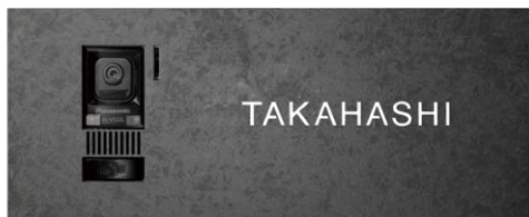
レイアウト 1 IP1-30-AN1B