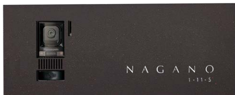
レイアウト 2 IP1-30-AN2C