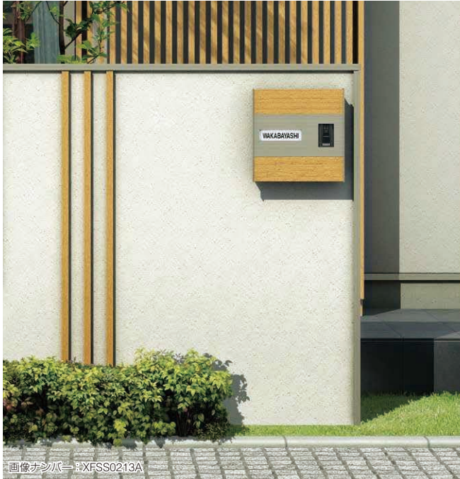
インターホン加工付き・正面パネル：ハニーチェリー色

●インターホン、照明は配線工事が必要となりますので、あらかじめ電気工事店と打合せを行ってください。