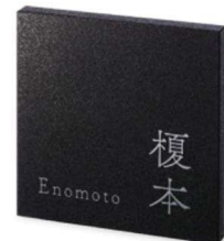
PTK-2 ステンレスエッチング

参考価格 56,000円(税込61,600円) ● 参考サイズ: 185W×185H×8~20D(mm) ● エッチング 文字凸磨き 下地梨地黒 ● 書体: 筑紫アンティーク明朝&欧文 筑紫アンティーク明朝