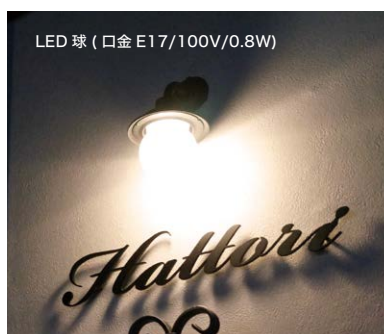
LED 球 (口金 E17/100V/0.8W)