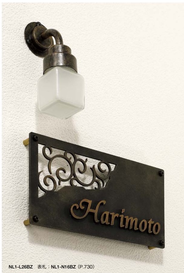
NL1-L26BZ 表札 : NL1-N16BZ (P.730)