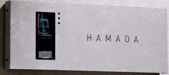
写真は左用 (L) です

インターホンの高性能はそのままに、 オリジナリティをプラスしたインターホンカバーで ワンランク上の演出を。