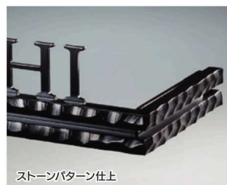
ストーンパターン仕上