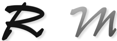
ブラック 品番：AG1-GRM1B 書体 サルサ