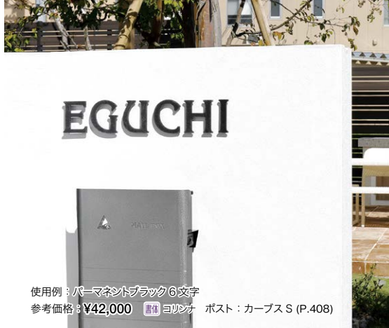
使用例：パーマネントブラック 6文字 参考価格：¥42,000 書体 コリナナ ポスト：カープS (P.408)

耐久性が高く、錆に強い厚み 3mm のステンレス (SUS304) を採用した、インパクトのある文字表札です。