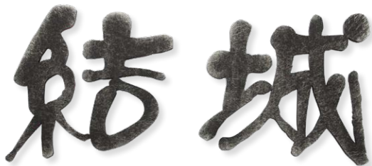
品番：AG1-GRKMP 書体 唐草