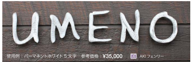
使用例：パーマネントホワイト 5文字 参考価格：¥35,000 書体 AKI フェンリー