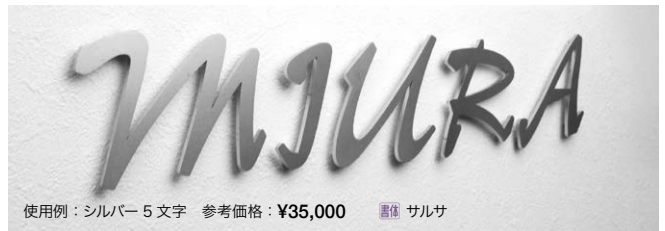
使用例：シルバー 5文字 参考価格：¥35,000 書体 サルサ

品番：AG1-GRM1 □ OnlyOne 価格：¥7,000 / 文字 ※ 品番末尾の□にはカラー記号が入ります。下記 Color Variation 参照 サイズ (mm)：約 W45 ~ 120 角程度×3t (スタッド 35mm) 重量 (kg)：最大約 0.2 (文字により異なる) 書体 英字のみの対応 (書体 785-J 参照) サルサ、コリナナ、センチュリーゴシック、AKI フェンリー