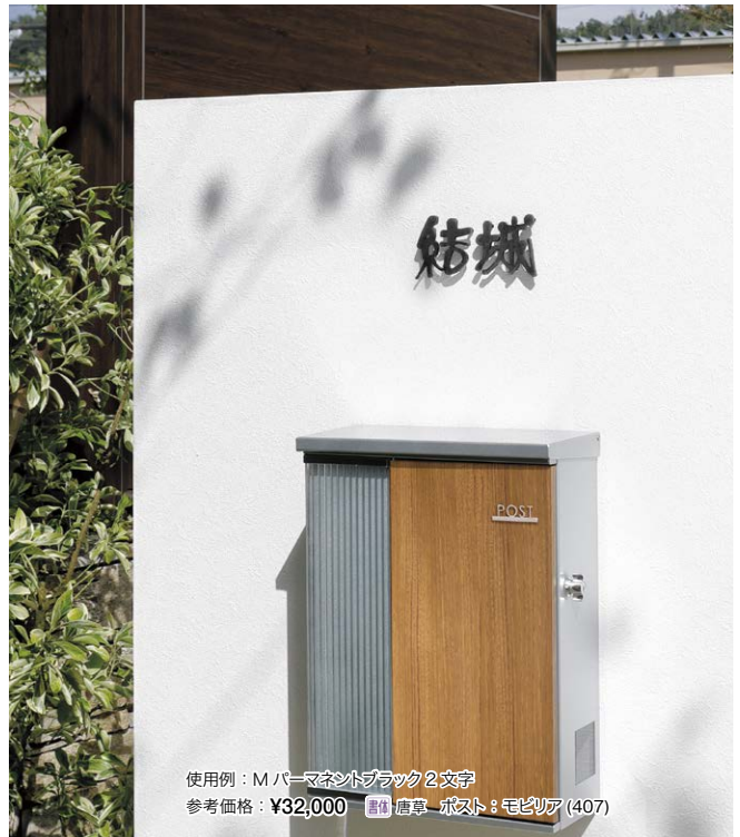
使用例：Mパーマネントブラック 2文字 参考価格：¥32,000 書体 唐草 ポスト：モビリア (407)