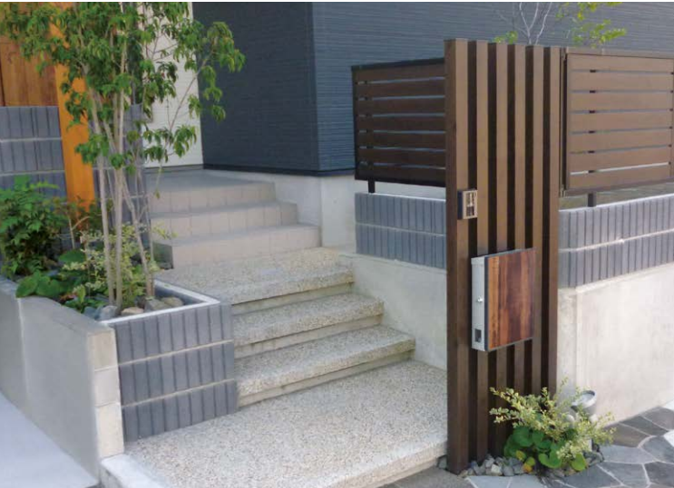
ブラウンアッシュ