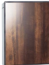
ブラウンアッシュ