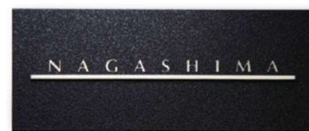
KT-103 ステンレス板エッチング