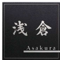
KT-115 ステンレス板エッチング