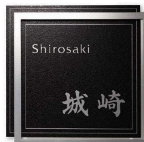
KT-113 ステンレス板エッチング