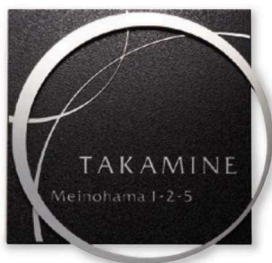
KT-110 ステンレス板エッチング