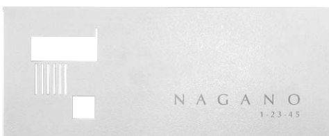
レイアウト 2 IP1-30-2W 欧文：G.Optimum