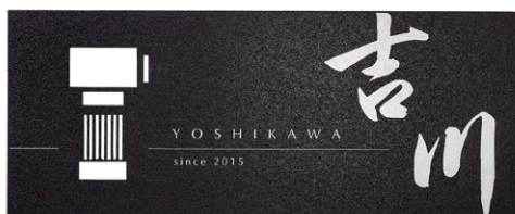
レイアウト 1 IP1-30-1B 和文：8. 筆文字 欧文：G.Optimum

エントランスに合わせてバランスの良いインターホンカバーをご検討いただけます。 全埋め込み、半埋め込み、完全凸、インターホンの位置などご相談いただければ ご提案いたします。ハウリングの起こらない最高の加工技術で製作いたします。