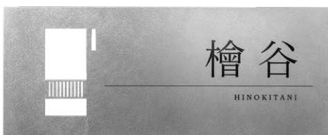
レイアウト 3 IP1-30-3R 和文：3. 明朝体 欧文：H.Bookman